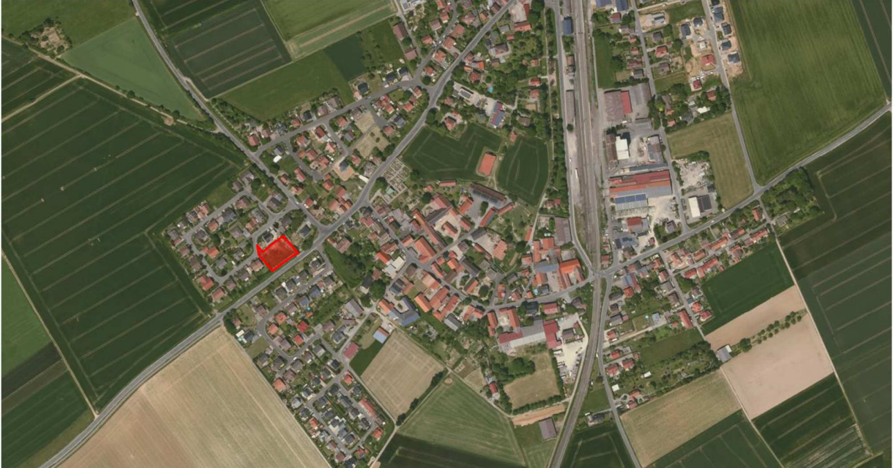
Abbildung 3: Luftbild mit Umgriff (rote Schraffur)

Die geplanten Bauflächen werden im Süden durch die Staatsstraße 511 begrenzt. Das Plangebiet liegt innerhalb eines Wohngebietes. Unweit des geplanten Baugebietes verläuft östlich die Bahnlinie zwischen Würzburg und Stuttgart.