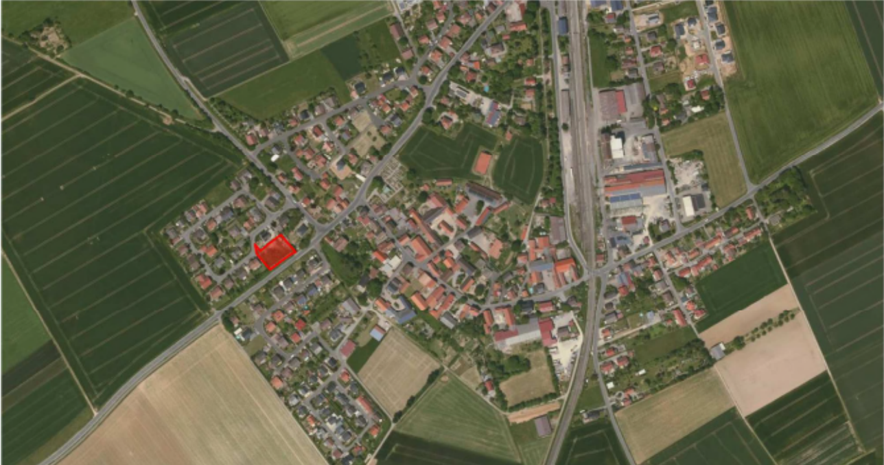
Abbildung 3: Luftbild mit Umgriff (rote Schraffur)

Die geplanten Bauflächen werden im Süden durch die Staatsstraße 511 begrenzt. Das Plangebiet liegt innerhalb eines Wohngebietes. Unweit des geplanten Baugebietes verläuft östlich die Bahnlinie zwischen Würzburg und Stuttgart.