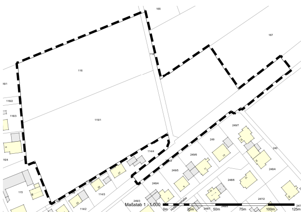
Lageplan (ohne Maßstab)

Der Geltungsbereich ist im nachfolgenden Lageplan dargestellt: